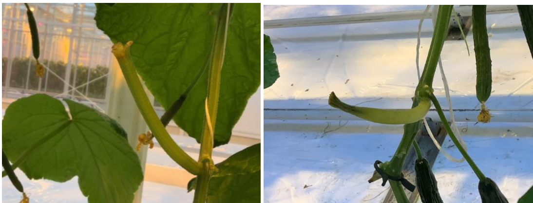
Figuur 2. Links: Stompje zonder infectie. Rechts: Stompje met infectie.