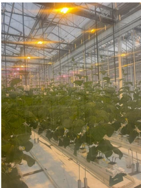
Figuur 1. Het gewas vlak voor de eerste toepassing

De proef is uitgevoerd in een afzonderlijke onderzoeksafdeling van 86 m 2 . In oktober 2024 zijn komkommerplanten van het ras Hi-Light geplant op steenwol matten geplaatst op goten (figuur 1). Een veld bestond twee matten van één meter met vijf planten per mat. De proef is opgezet met 24 proefvelden. Het onderzoek is in vier herhalingen uitgevoerd.