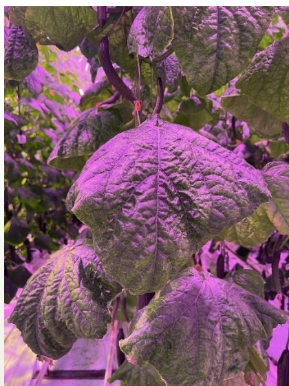
Figuur 3. Fytotoxiciteit bij Code B (+ Silwet Gold).

Bij behandelingen Vintec + Silwet Gold en Code B (+ Silwet Gold) is fytotoxiciteit als gevolg van de bespuitingen waargenomen. In het geval van Vintec + Silwet Gold was een snellere slijtage aan de onderkant van het gewas zichtbaar. In deze proef is er geen blad gesneden wat in de praktijk wel gebeurt waardoor deze fytotoxiciteit in de praktijk niet zichtbaar zal zijn. Bij Code B(+ Silwet Gold) was groeischade bovenin het gewas waargenomen (figuur 4).